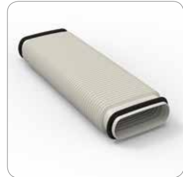
Flexibel koppelstuk - G0013139

De glad afgewerkte binnenwand heeft antistatische eigenschappen die ophoping van stof en het uitbreken van bacteriehaarden voorkomen.