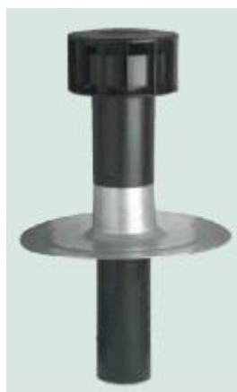
Type 1 : ø131/150 Ref. 66014250 Type 2 : ø166/150 Ref. 66014260