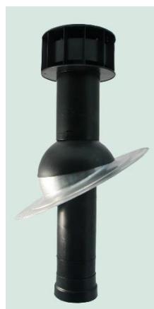
Type 1 : ø131/150 Ref. 66014251 Type 2 : ø166/150 Ref. 66014261